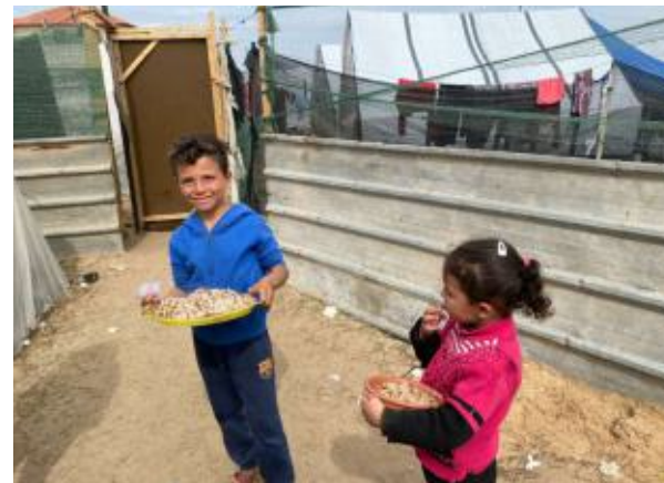
Distribution de nourriture aux familles déplacées dans la zone de Mawasi Rafah, février 2024.