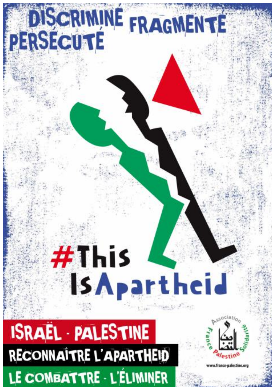
L'apartheid a été défini en 1973 par l'Organisation des Nations Unies.